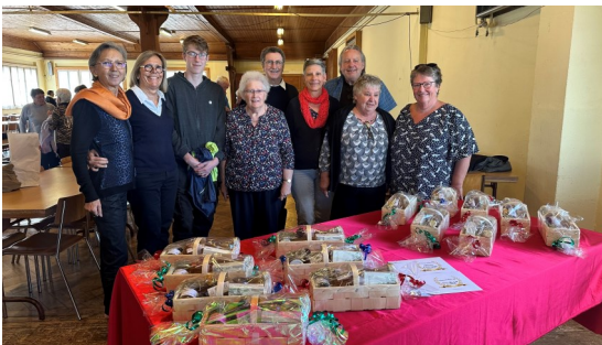
Les lauréats du Trophée FSSc par séries 2022-2023